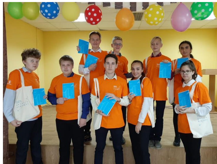
МБОУ «Маталлплощадская СОШ» Кемеровский МО