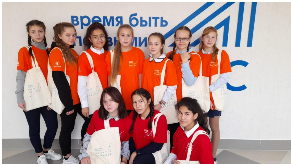
МБОУ «Ягуновская СОШ» Кемеровский МО