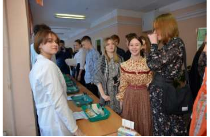
В салоне «Каллиграфия» был проведён конкурс и объявлены победители